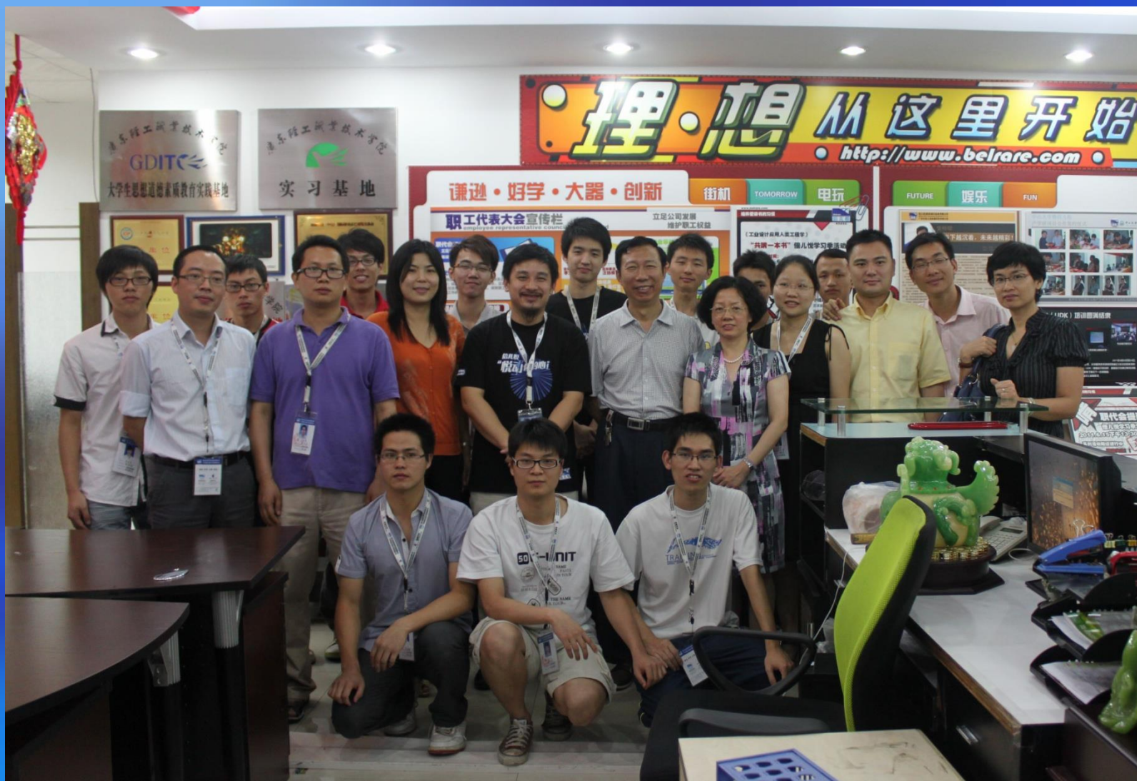
机电计算机系学生到倍儿悦公司开展德育实践教学