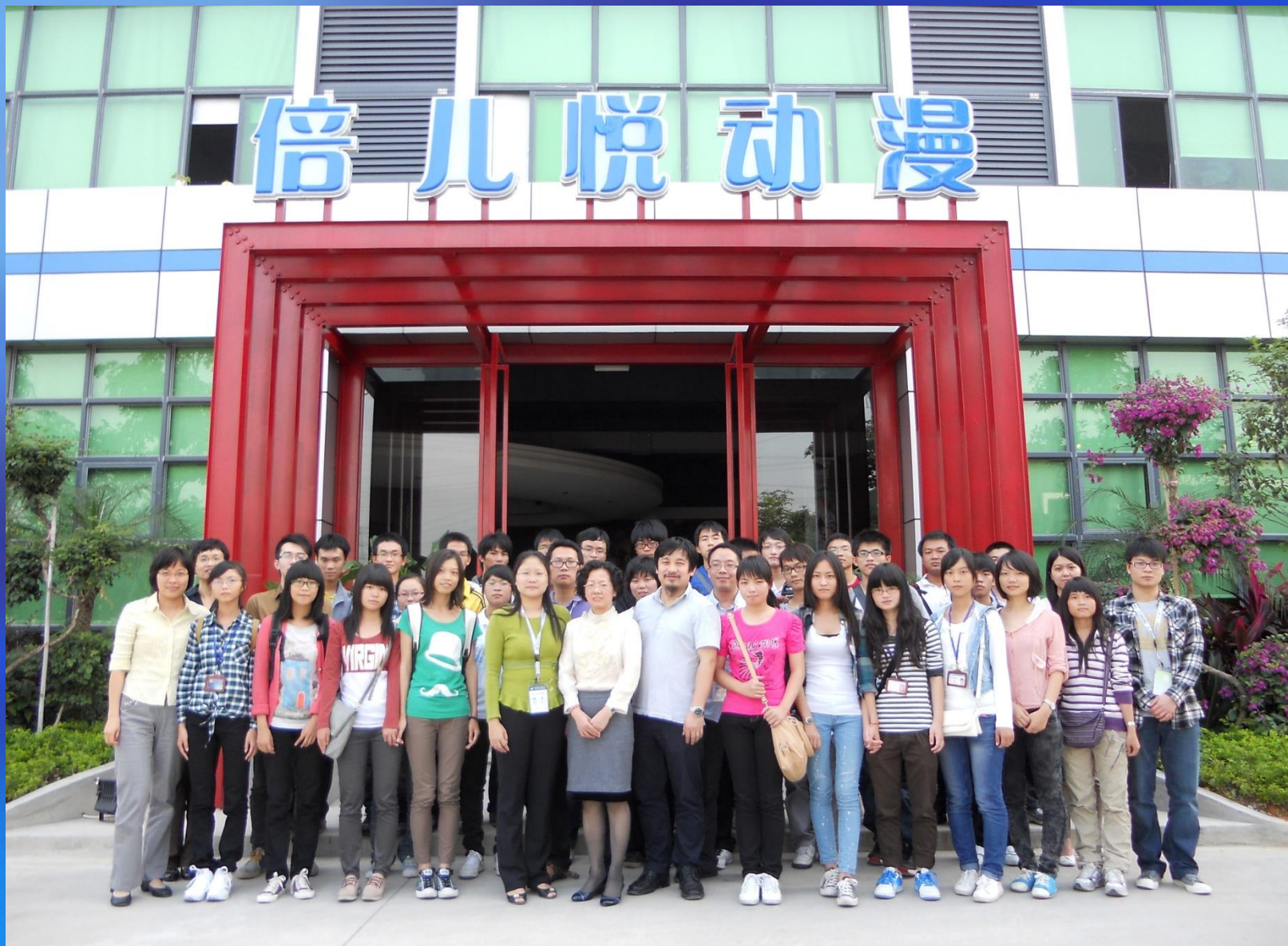
机电计算机系学生到倍儿悦公司开展德育实践教学